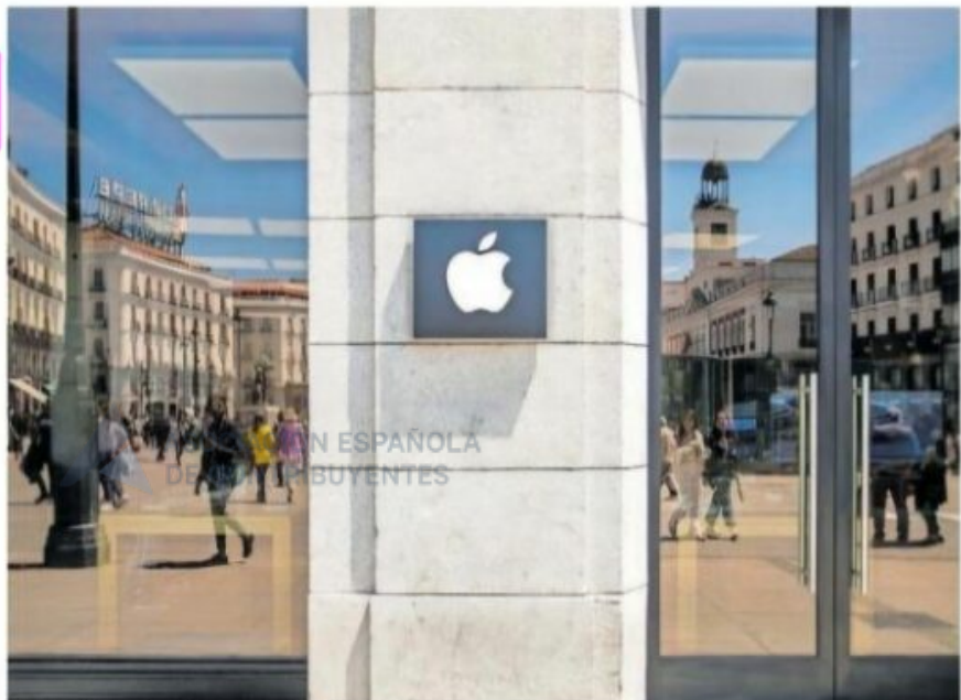
Tienda de Apple en la Puerta del Sol, en Madrid.

El documento, elaborado a partir de los datos recopilados por la Organización para la Cooperación y el Desarrollo Económicos (OCDE), estima que las multinacionales con presencia en España